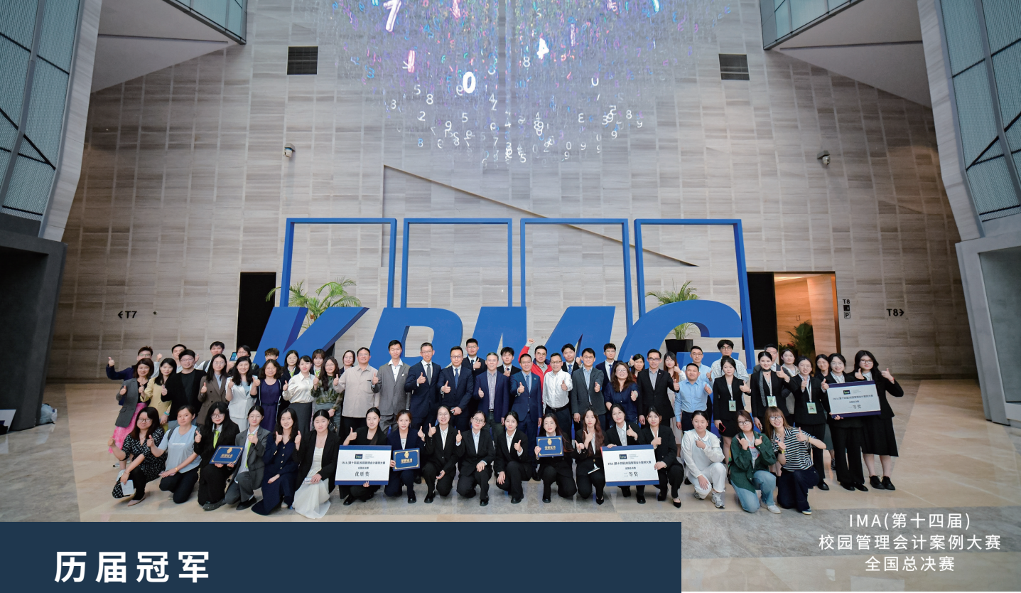
IMA(第十四届) 校园管理会计案例大赛 全国总决赛